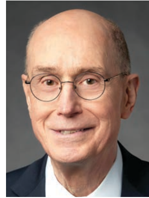
Henry B. Eyring Segundo Conselheiro