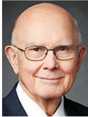
Dallin H. Oaks Primeiro Conselheiro