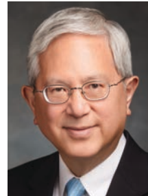
Gerrit W. Gong