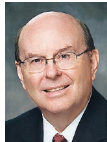
Quentin L. Cook