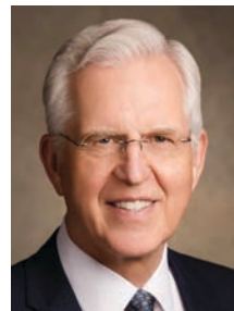
D. Todd Christofferson