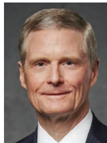
David A. Bednar