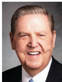
Jeffrey R. Holland