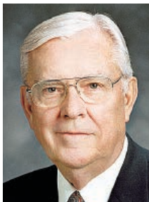
M. Russell Ballard