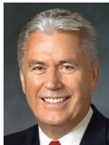
Dieter F. Uchtdorf